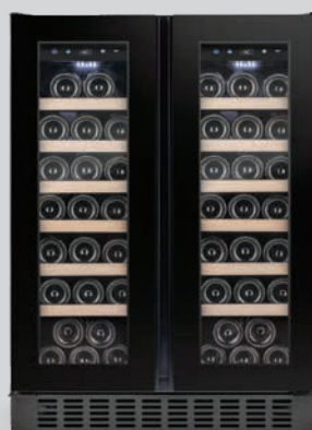
OX2DX60DRB cornice nera