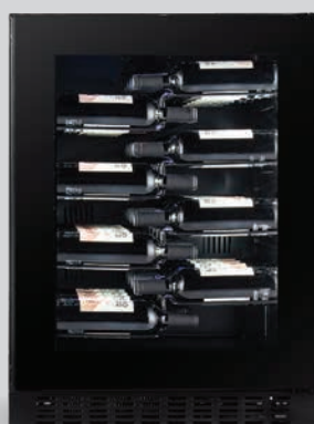
CPROX60SRB cornice nera