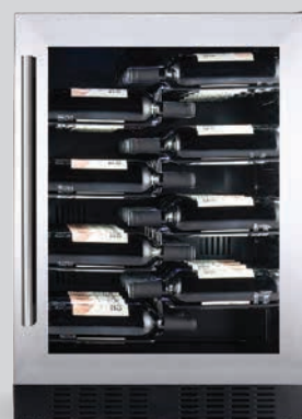
CPRO1X60SX cornice in acciaio inox